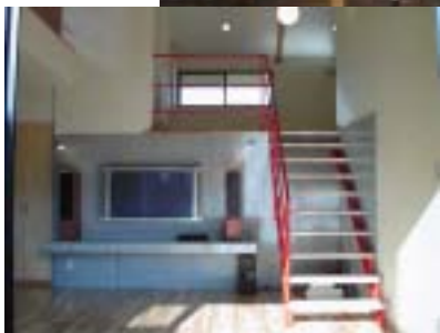
夫婦の想いが形になった本物空間

今回ご紹介した2家族は、本当に素敵な家づくりを実践され、素敵な暮らし方をされています。下記にご案内する7月19日から開催の見学会も、又違う価値観の素敵な暮らし方をする為に創られた空間です。 是非、あなたも素敵な暮らし方・家族の価値観を形にしてください。