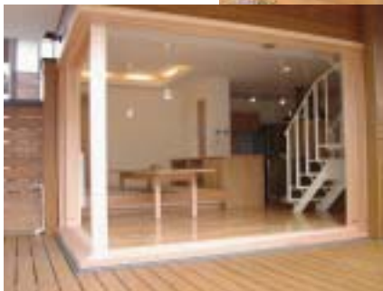
ウッドデッキとリビングが繋がった空間

次のメッセージは『家族の声が聞こえる空間』をコンセプトとし、本物の素材にこだわって作り上げたO様からのメッセージです。