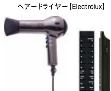
ヘアードライヤー [Electrolux]