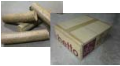
木質ブリケット【匠の薪】