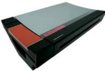
FAX 電話機 [amadana]

amadana (アマダナ)・Electrolux に関しては宮津市喜多のカナガワデンキさんで取扱っておられます。お問合せは下記までどうぞ。もちろんハーモニーライフに問い合わせいただいても結構です。【カナガワデンキ TEL 0772-22-5940】