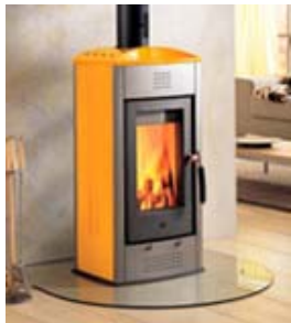
イタリア製薪ストーブ

そこでハーモニーライフがお薦めするのは薪ストーブを楽しむ暮らしです。イタリア製のデザインされた薪ストーブで暖をとりながら、家族でクリスマスを楽しむ。もしかしたら煙突からサンタさんが入ってくるかも？って子供達はワクワクしそうです。面倒な薪の調達には宮津匠の会で生産するバイオマス燃料・木質ブリケット（箱入りの再生薪）を使用すれば何の心配もありません。ランニングコストも灯油より安くいられます。ストーブ本体は陶版で被覆された対流式のタイプですから火災や火傷の心配も少なくてすみます。気になる費用の方はストーブと煙突工事とで合計40〜50万円くらいはかかりますが、孫の代まで使えますから決して高い買い物ではありません。それにバイオマス燃料を使う事で、使えば使うほど地球温暖化防止に貢献できます。何ととっても電気もガスも灯油の配達も必要ありませんから、災害で停電になってもライフラインが途絶えても凍える事はありません。是非この冬デザインされた美しい薪ストーブでスローライフな冬を楽しみませんか？