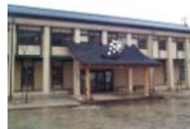
天橋立ワイナリー外観

また、こちらの会社はワインの楽しめるお宿も営んでおられる。ワイナリーとは反対側の宮津市文珠にある『千歳』だ。こちらでは高級ワインからテールワインまで数千種類が常時保管してあり宿泊しなくても美味しいお食事とワインが楽しめる。是非一度、天橋立ワイナリー・千歳へ足を運んでいただき、いつもと違った時間を過ごしていただきたいと思う。見慣れた天橋立も、また違った風に見え、改めて宮津の良さに気付くかも知れない。 最後に、お忙しい中取材に協力して下さいましたワイナリーのスタッフの方にお礼申し上げます。